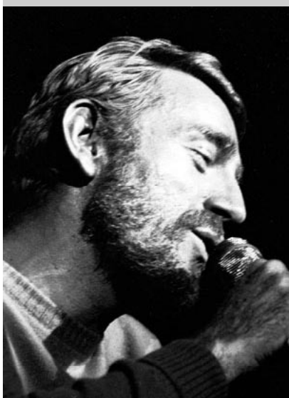
Rod McKuen, ovvero il fiuto di tradurre per primo Brel in inglese

Tra le altre canzoni ce n’è una molto fortunata, ed è LE MORIBOND. La sua fortuna deriva da due eventi successivi, che ne hanno determinato una lunga storia molto interessante da raccontare. All’inizio di tutto c’è la traduzione in inglese fatta dal folk-singer e poeta californiano Rod McKuen, il primo che ha tradotto assiduamente Brel in inglese. La sua traduzione del 1965 (SEASONS IN THE SUN), pur conservando come traccia la storia di un moribondo che lascia l’ultimo saluto alle persone più care, ne ha di molto semplificato il contenuto. Scompaiono molte delle allusioni sarcastiche più sottili, sostituite da alcune immagini che vorrebbero essere poetiche ma risultano più che altro melense, una poesia da Baci Perugina che però può piacere al pubblico di massa ( Goodbye my friend it’s hard to die! | When all the birds are singing in the sky, trad.:Arrivederci amico mio, è difficile morire|Quando tutti gli uccelli cantano in cielo è solo un esempio del tono usato da McKuen).